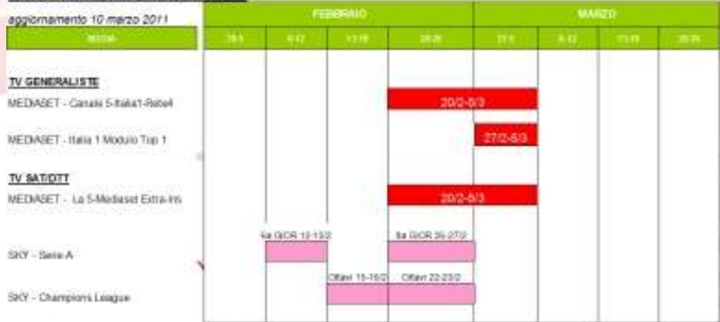
AREXONS AIRTECH - ipotesi piano media